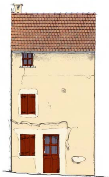
enduit de parement ton beige porte, volets et fenêtres : RAL 3004 ou 3005, aspect mat ou satiné

Les teintes grises sont neutres et mettent en valeur la tonalité de l'enduit. Si le gris est utilisé sur les menuiseries et les volets, la porte d'entrée pourra être mise en valeur par une teinte plus soutenue. Menuiseries et volets sont de la même couleur, mais une valeur légèrement plus claire pourra être appliquée sur les menuiseries.