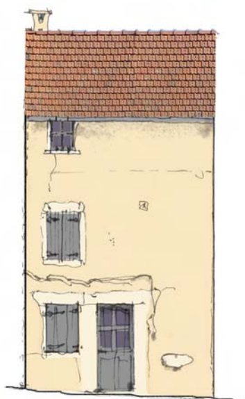
enduit de parement ton beige porte, volets et fenêtres : RAL 7045 aspect mat ou satiné