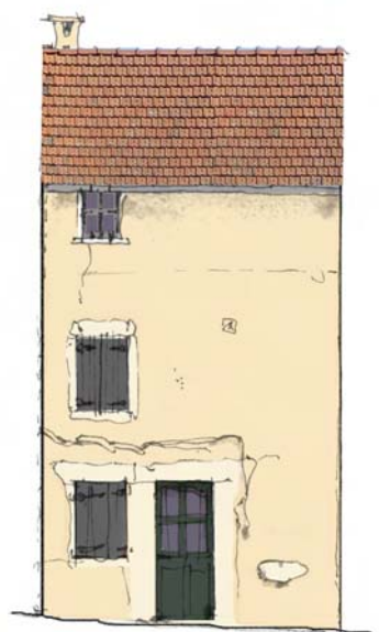
enduit de parement ton beige volets et fenêtres : RAL 7046 aspect mat ou satiné porte d'entrée : RAL 6003 aspect mat ou satiné